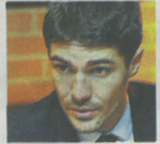
AURÉLIEN PRADIÉ > Liste Dominique Reynié (Les Républicains).