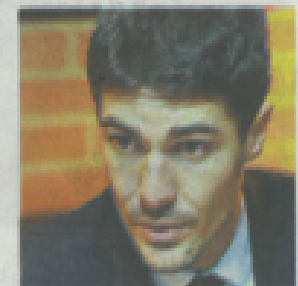
AURÉLIEN PRADIÉ > Liste Dominique Reynié (Les Républicains).