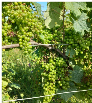
Botrytis sur Chardonnay