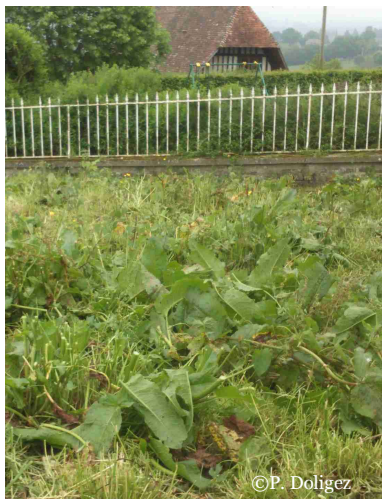
Fauche des hampes florales

Reseimer rapidement les zones nues avant que les adventices ne prennent la place. Attention la concurrence avec le rumex est plus que rude lors du semis !