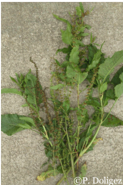
Récolte des hampes florales avant maturité des graines

La fauche avant le stade de maturité des graines (stade floraison), ainsi que le ramassage des inflorescences permet de limiter la dissémination par les graines. L'efficacité de cette technique n'est pas très bonne, tant la quantité de graines est importante.