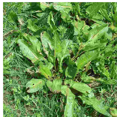
Rumex à feuilles obtuses - stade rosette

● Rumex crépu : il s'installe plutôt sur les sols secs calcaires parsemés de zones nues. Les feuilles sont longues, ondulées à bord frisé.