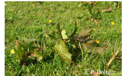
Rumex à traiter en localisé

● Attendre 10 à 15 jours (selon la notice) avant de réintroduire les animaux.