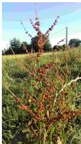
Hampe florale de rumex

Une semaine après la floraison, le pouvoir germinatif des graines est déjà élevé. Les graines sont particulièrement résistantes aussi au passage dans le tube digestif des animaux lorsqu'elles sont ingérées (dans le fourrage par exemple).