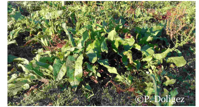
Bout de parcelle envahie par le rumex

Une fertilisation azotée et potassique importante et un hersage très régulier peuvent être des facteurs favorables à la dissémination du rumex.