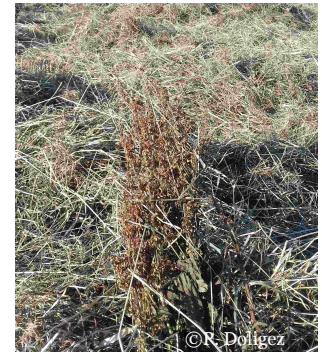
Rumex contaminant le foin en cours de récolte