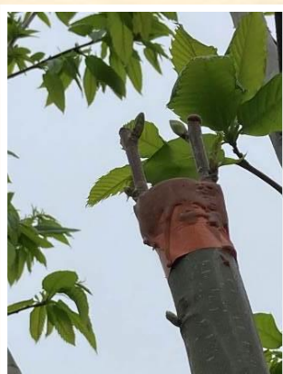
Débourrement en cours des bourgeons des greffons. 8 mai 2023.

Il est temps de tuteurer la nouvelle pousse issue de la greffe afin qu'elle ne casse pas avec le vent ou les oiseaux, de supprimer tous les rejets sur le porte-greffe.