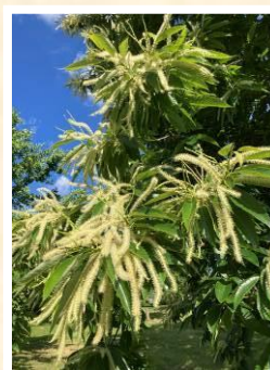
Marigoule Châtons Longistaminés

Sud Corrèze - 11 juin 2023