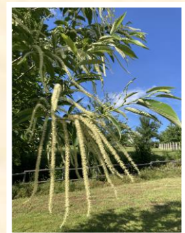
Maraval Châtons très longs pour Maraval