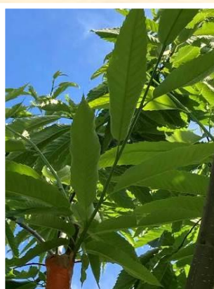
Pousses de 50cm protégées u vent par les branches du Porte-greffe 11 juin 2023