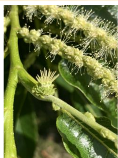
Fleur femelle de Marigoule en pleine réceptivité du pollen.